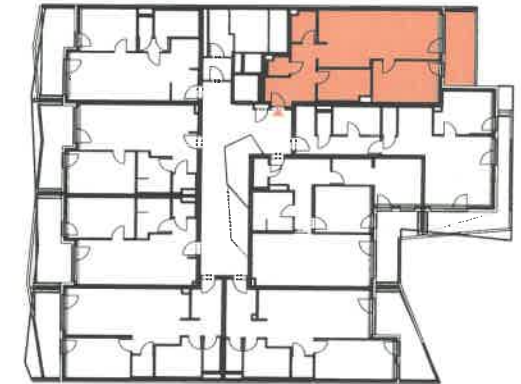
Übersichtsplan OG 4