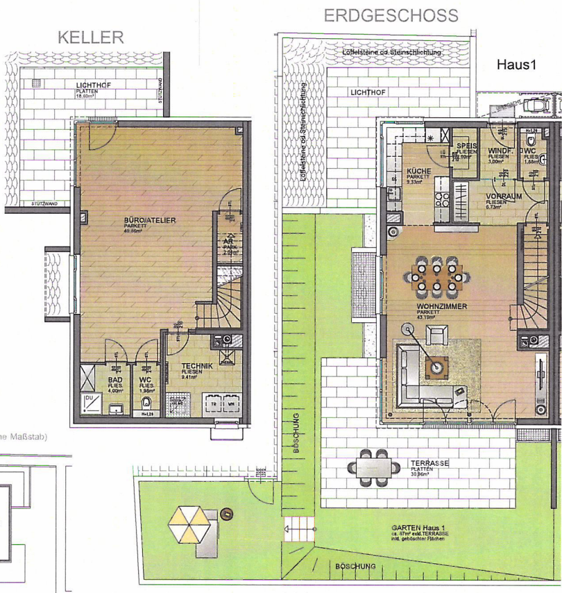
ÜBERSICHTSPLAN (ohne Maßstab)